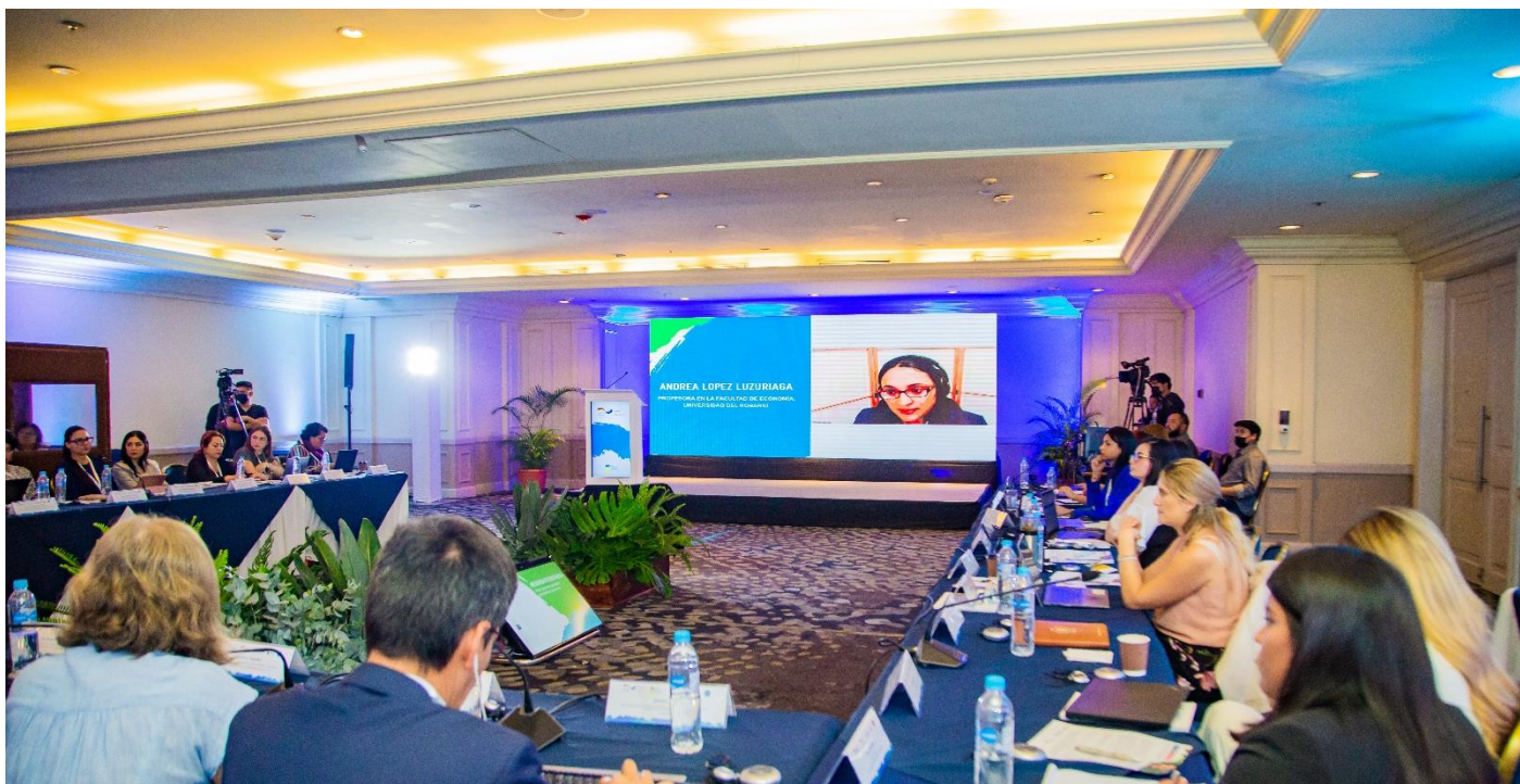
Pie de foto: Fotografía programa Buena Gobernanza Financiera del Seminario Internacional sobre Tributación y Género realizado en El Salvador, San Salvador 7 y 8 de noviembre.

Este encuentro ha sido solo un primer paso hacia un trabajo coordinado con las administraciones e instituciones fiscales de la región junto a expertos para aportar a este tema.