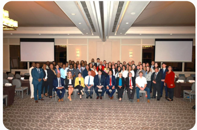
Participantes del seminario sobre ISORA, Panamá.

Organizado por el Fondo Monetario Internacional (FMI) junto con el CAPTAC-DR y el Centro Regional de Asistencia Técnica del Caribe (CARTAC), en colaboración con el Centro Interamericano de Administraciones Tributarias (CIAT) y la Organización para la Cooperación y el Desarrollo Económicos (OCDE), el taller combina presentaciones técnicas y ejercicios prácticos para fortalecer el uso aplicado de esta herramienta y promover el intercambio de experiencias entre participantes.