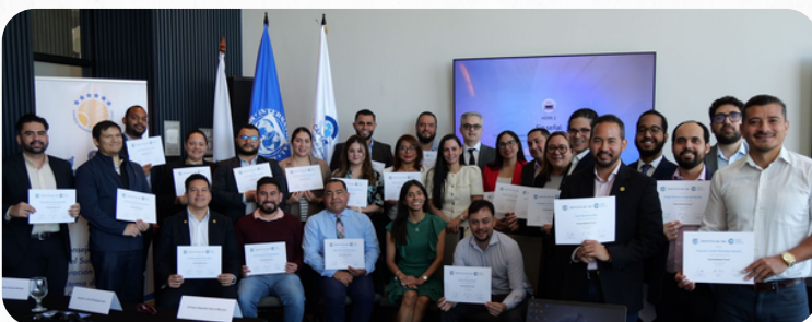
Participantes del curso sobre sostenibilidad fiscal.

A lo largo del curso, los participantes aplicaron la Herramienta de Dinámica de la Deuda Pública (DDT, por sus siglas en inglés) para analizar la trayectoria de la deuda bajo distintos escenarios y evaluar estrategias de ajuste fiscal consistentes con objetivos de sostenibilidad. El enfoque práctico promovió el intercambio de experiencias entre países y fortaleció el uso de herramientas analíticas para la toma de decisiones.