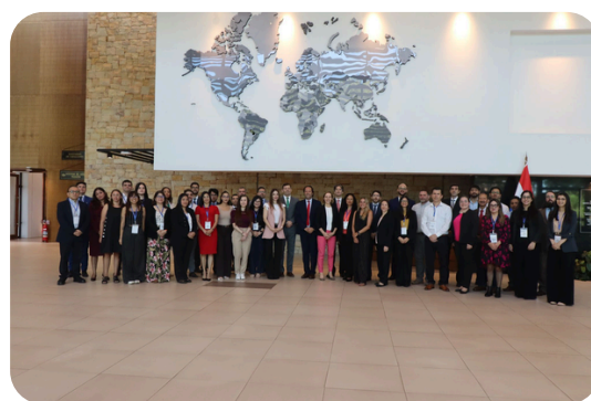
Participantes del curso sobre gestión de riesgos fiscales, Paraguay.

En Asunción, Paraguay, se llevó a cabo el curso presencial “Gestión de Riesgos Fiscales”, organizado por el Fondo Monetario Internacional (FMI), CAPTAC-DR y el Instituto del Banco Central del Paraguay (IBCP), en el marco de su programa regional de capacitación. La actividad reunió a funcionarios de distintos países para profundizar el análisis de riesgos fiscales, abordando temas clave como riesgos macroeconómicos, sostenibilidad fiscal, empresas públicas, garantías y cambio climático.