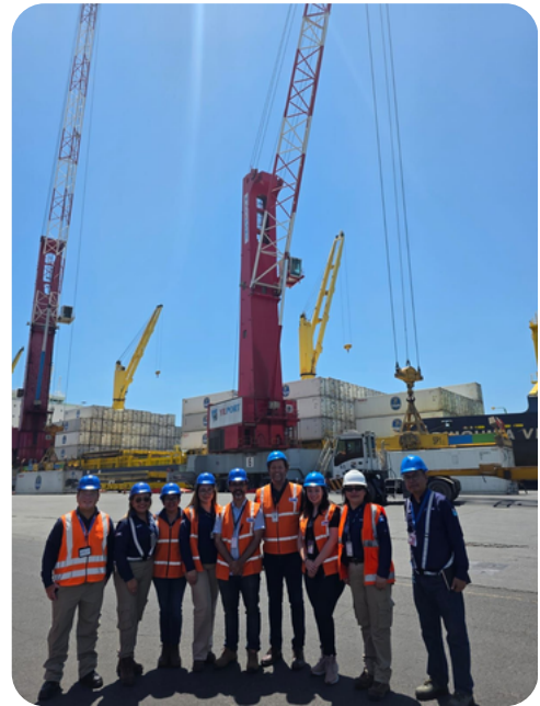
Visita a Puerto Quetzal, Guatemala.

La visita también permitió abordar aspectos vinculados a la gestión de riesgos y a la mejora de los procesos operativos, en un contexto práctico. CAPTAC-DR agradece a la Superintendencia de Administración Tributaria (SAT) por su colaboración y disposición para este intercambio.