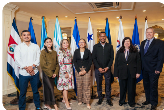
Participantes y facilitadores del seminario regional sobre estadísticas de finanzas públicas y cuentas nacionales.

El encuentro reafirma la importancia del trabajo conjunto, el intercambio de experiencias y la coordinación regional para avanzar en el desarrollo de capacidades técnicas. Asimismo, marca la reactivación de esfuerzos orientados al fortalecimiento del Sistema de Cuentas Nacionales a través del CAPTAC-DR, en línea con las prioridades de los países miembros. Este tipo de iniciativas contribuye a desarrollar herramientas más sólidas para la toma de decisiones y a promover un crecimiento económico sostenible basado en información de calidad.