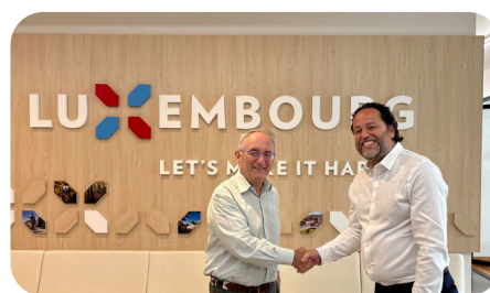
Reuniones con representantes de Luxemburgo.