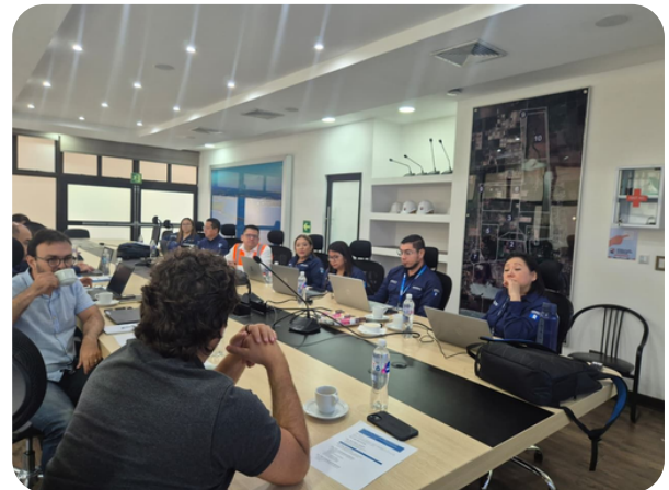
Reunión con oficiales de aduanas.