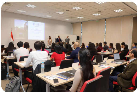
Participantes y facilitadores del curso sobre gestión de riesgos fiscales, Paraguay.

El programa combinó sesiones técnicas, ejercicios prácticos y trabajo colaborativo, promoviendo el intercambio de experiencias y el aprendizaje entre pares. Este enfoque aplicado contribuye al fortalecimiento de marcos fiscales más resilientes, transparentes y sostenibles en la región, con el apoyo de socios para el desarrollo que facilitan la participación de los países miembros y refuerzan la cooperación internacional en materia de desarrollo de capacidades.