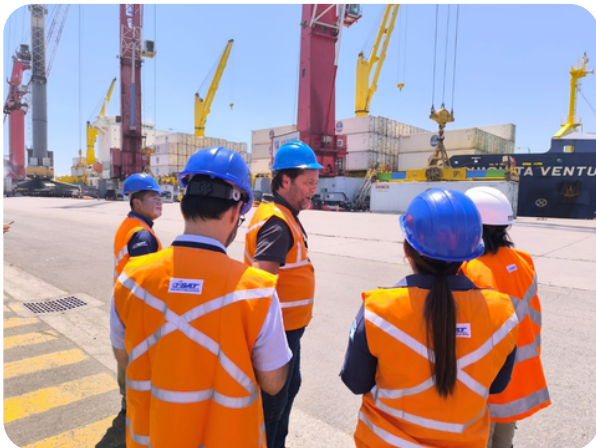
Reunión con oficiales de aduanas.